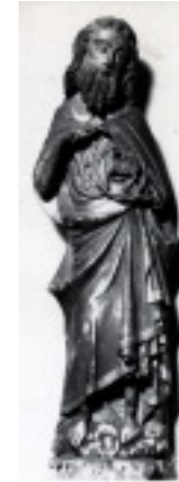
یحیی تعمید دهنده - مجسمه ای در موزه لیون فرانسه

یعقوب سهیم باشد. به علاوه بر حسب سنت متأخر یهود نام اسرائیل به معنای زیباترین نامها به مانند «کسی که خدا را می بیند» تعبیر گردیده است. نتنائیل «پاکدل» (ر. ک موعظه عیسی بر کوه مت ۵:۸) شایسته و سزاوار آن بوده است که «خدا را ببیند». عیسی به وی که معرف ایمانداران با روحی ساده و راست است می گوید: «شما خواهید دید...» آنها چه خواهند دید؟ آنان تحقق رؤیای یعقوب، پدر قوم را خواهند دید، آنان فرشتگان را خواهند دید که بر پسر انسان که از این پس تنها رابط بین آسمان و زمین است، صعود و نزول می کنند. فرشتگان نشان شکوه اند، شکوهی که اعلام کننده نخستین «نشان های» عیسی است.