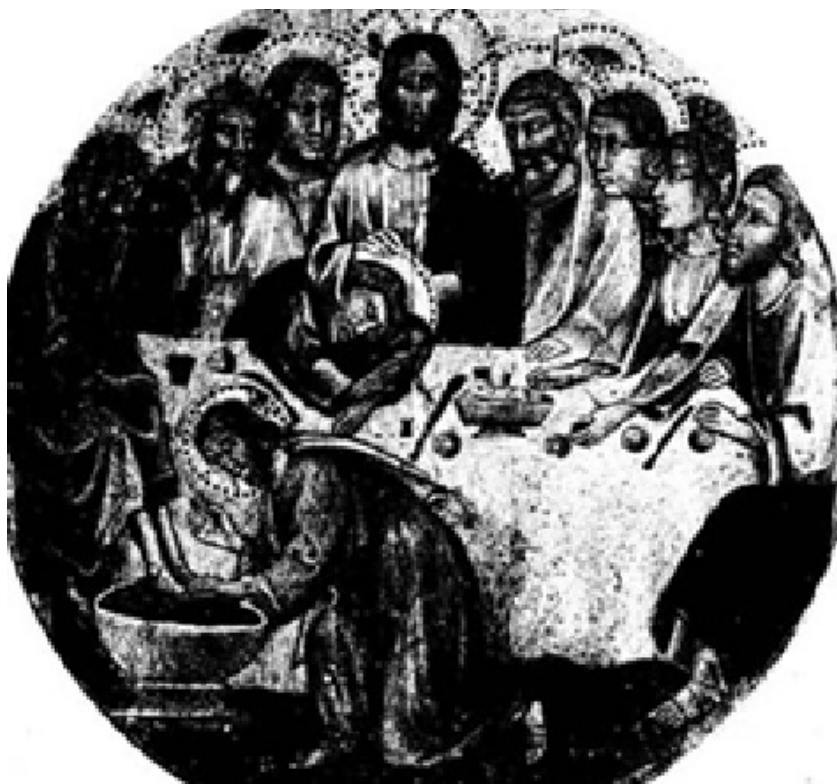
حرکت نمادین شستن پاهای شاگردان بیانگر محبت مسیح نسبت به انسانهاست.

پیشاپیش گذر خود از مرگ را به عنوان نشانه‌ای از عشق به مردم در وفاداری کامل نسبت به پدرش عهده‌دار می‌شود. همین امر است که باید از آن یاد کرد و ایمانداران با تکرار آیین راز قربانی مقدس خود را با وی در معرض خطر عشقی تمام و کمال برای خدمت به مردمان قرار می‌دهند. امتناع پطرس برعکس دلیل بر تردید وی نسبت به پذیرفتن گذر مسیح از مرگ است (همچون پس از اقرار به ایمان در قیصریه: مر ۸:۳۱-۳۳). اما کلام عیسی به پطرس نشان می‌دهد که شستن پاها امری اختیاری نیست و هرکس نپذیرد سهمی در ملکوت آسمانی نخواهد داشت.