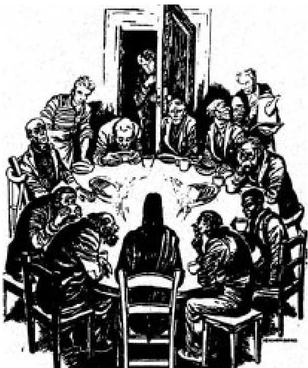
شام آخر، قربانی عیسی، آزادی قوم خدا

این یکی از زیباترین روایاتی است که لوقا برای تمام نسلهای مسیحی نگاشته است.