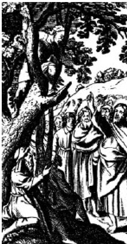
دعوت عیسی از ذکی، تصویری متعلق به قرن ۱۷

شادی و خدمت. این دو واژه در انجیل لوقا واژه های کلیدی محسوب می شوند. لای پس از اینکه عیسی وی را به پیروی از خود فراخواند به افتخار عیسی ضیافتی برپا نمود (لو ۵: ۲۹) و زکی با خوشحالی تمام عیسی را در منزلش پذیرفت (لو ۱۹: ۶). شادی آسمانی به هنگام توبه و بازگشت گناهکاران در ضیافتهایی که گناهکاران برای عیسی برپا می کنند دیده می شود.