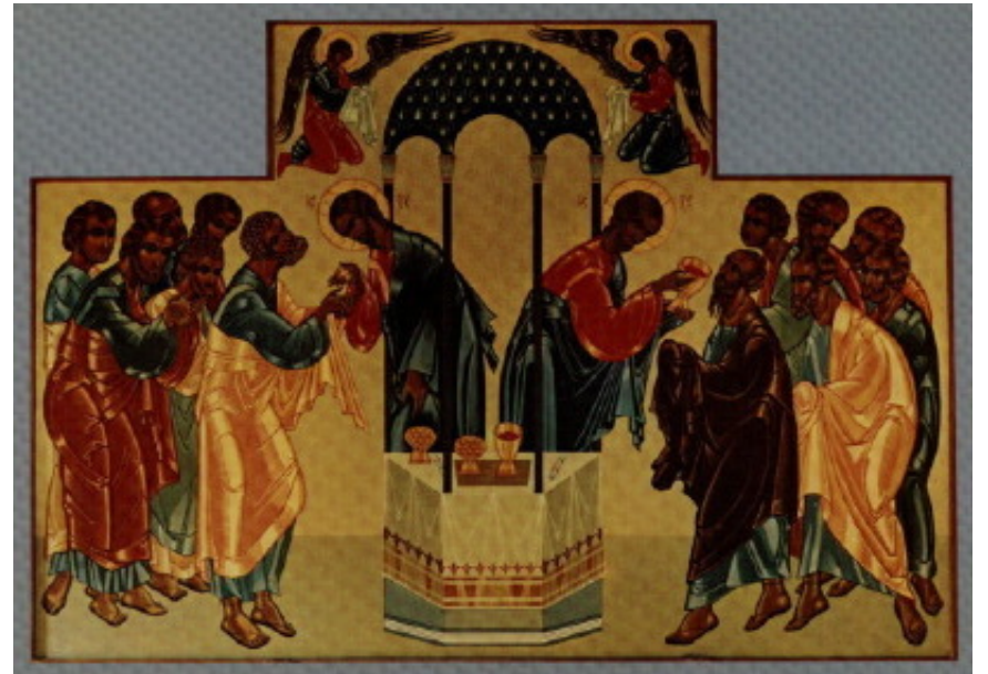
شمایل بیزانتینی، دوره معاصر

قوم خداوند با گذر از بردگی مصر به سوی پیمان با خداوند متعال در کوه سینا مهمترین تجربه زندگی روحانی خود را به دست آوردند. به وسیله این تجربه به صورت قوم در آمدند و حتی می توان ژگفت که این تجربه دین آنها به شمار می رفت. یهودیان هر سال این حوادث را در مراسم با شکوهی در عید فصح جشن می گیرند. این مراسم سالانه با یک وعده غذا که پر از علائم و نشانه ها بود، برگزار می شد. این یک وعده غذای مقدس خانوادگی بود که هویت آنان را آشکار می ساخت و به آنان متذکر می شد که با خداوند پیمانی استوار به وسیله گذر از بردگی مصر بسته اند. در اینجاست که تمام این مطالب و مفاهیم به هم ملحق شده و معنی با شکوه نان مقدس را روشن می سازد.