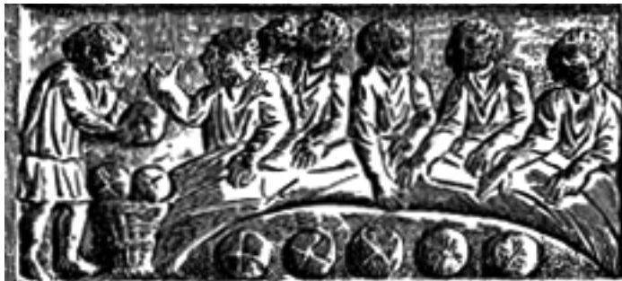
عشای ربانی، کنده کاری روی چوب مربوط به قرون اولیه مسیحیت

چنان که می بینیم از این دوران غالب مسائلی که بعدها برای نسل های مسیحی پیش خواهد آمد مطرح می شود، مسائلی از قبیل: چگونه در دنیایی به سر بریم که مسیحی نیست؟ چگونه زندگی روزمره، زندگی مدنی، سیاسی و اقتصادی را با روح انجیل عجین کنیم؟