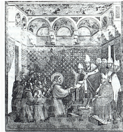
پاپ اینوسنت سوم در سال ۱۲۱۰ اسانامه نظام فرانسیسکن را می پذیرد و به اولین راهبان این نظام برکت می دهد.

می کنم بد نبود اگر پدرمان چند روزی به این جا می آمد. باید او را وادار نماییم از انزوای خود خارج شود».