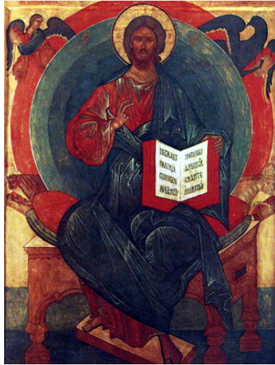
شمایل «مسیح در جلال»