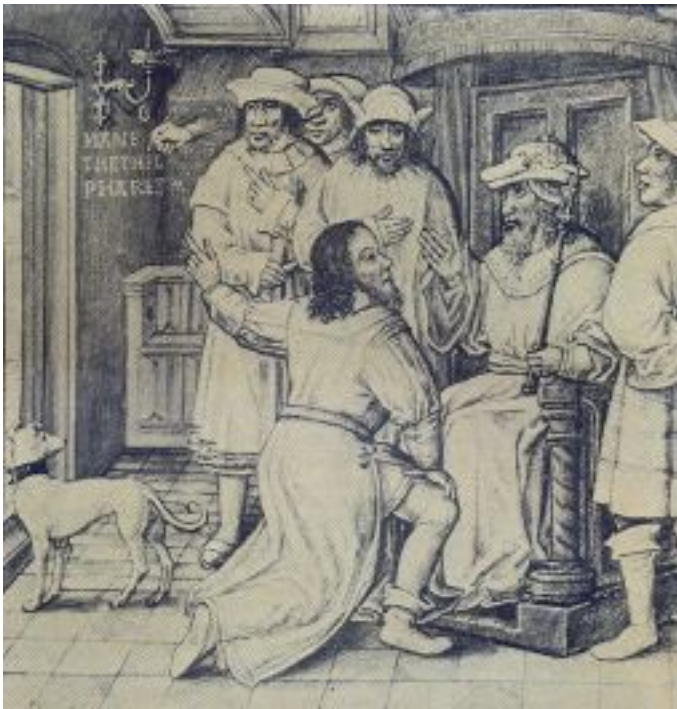
دانیال ۵: ۲۵-۲۸

خدای دانیال، خدای زنده است و همواره بیاید و ملکوت وی نابود نخواهد شد و سلطه وی تا پایان دوام خواهد آورد (۲۷:۶) مانند پسرانسان می آمد، تا نزد پیر پیش آمد و وی را به حضورش بردند و به وی سلطه، شکوه و حکومت داده شد و همه اقوام، ملت ها و زبان ها وی را خدمت می کردند. سلطه وی سلطه جاودانی است که هرگز پایان نخواهد داشت و قلمرو وی هرگز نابود نخواهد شد (۷:۱۳-۱۴). و قلمرو، سلطه و عظمت قلمروهای زیر آسمانها به قوم مقدسان باریتعالی داده خواهد شد. قلمرو وی قلمروی جاودانه است و همه قدرتها وی را خدمت کرده و اطاعت خواهند نمود (۷:۲۷).