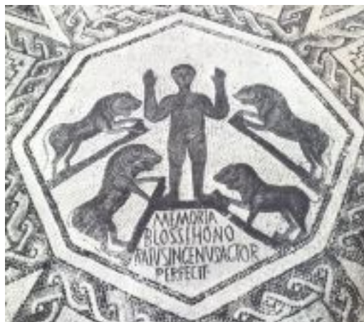
دانیال در چاه شیران. موزاییک در یک مقبره در رم

گرفته خواهد شد. هم چنین در اندیشه مباحث چگونه آن را افزون خواهی کرد زیرا به کسی که دارد بیشتر داده خواهد شد. به مانند دانه بذری که نمو کرده و ثمره می دهد به همان گونه در مورد ملکوت برای تو خواهد بود.