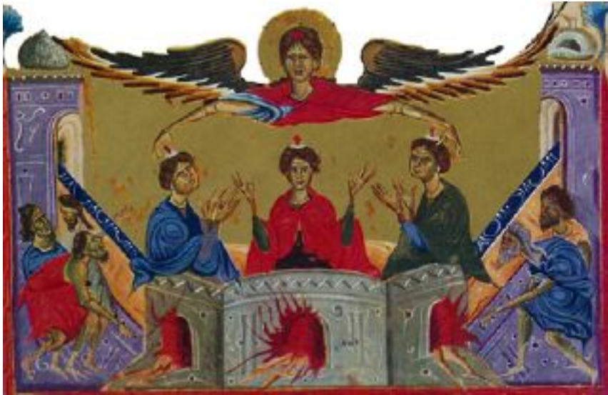
شمایل سه جوان در کوره آتش

پایان روزگار به تمامیت برسد. عیسی از زمان رستاخیز خود بر آدمیان سلطنت خود را اعمال می‌کند و «خداوند جهانی» (فی ۲: ۱۱) «پادشاه پادشاهان، رب الارباب» است (مکا ۱۹: ۱۶)؛ در پایان روزگار «ملکوت را به خدا و پدر سپارد» (۱-قرن ۱۵: ۲۴)؛ ایمانداران «میراثی در ملکوت مسیح و خدا» دریافت خواهند کرد (افس ۵: ۵)؛ ولی از هم اکنون در این دنیا «ملکوتی از کهنه برای خدا و پدر خود» تشکیل می‌دهند (مکا ۶: ۱) و پیروزی قطعی او را آرزو داشته و درخواست می‌کنند: «ای پدر! ملکوت تو بیاید!».