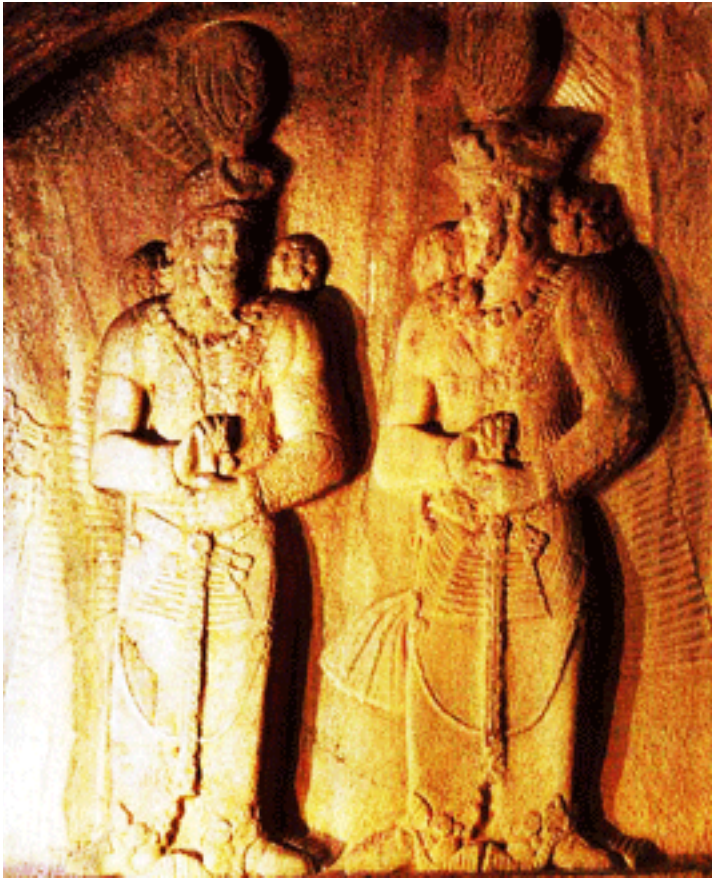
نقش شاپور دوم و شاپور سوم در نزدیکی کرمانشاه

ایلچیگری، از طرف امپراتور روم به ایران فرستاده می شد. این شخص، علاوه بر مقام روحانی، طبیب هم بود و یزدگرد را از مرضی شفا داد و او را فوق العاده از خود ممنون ساخت.