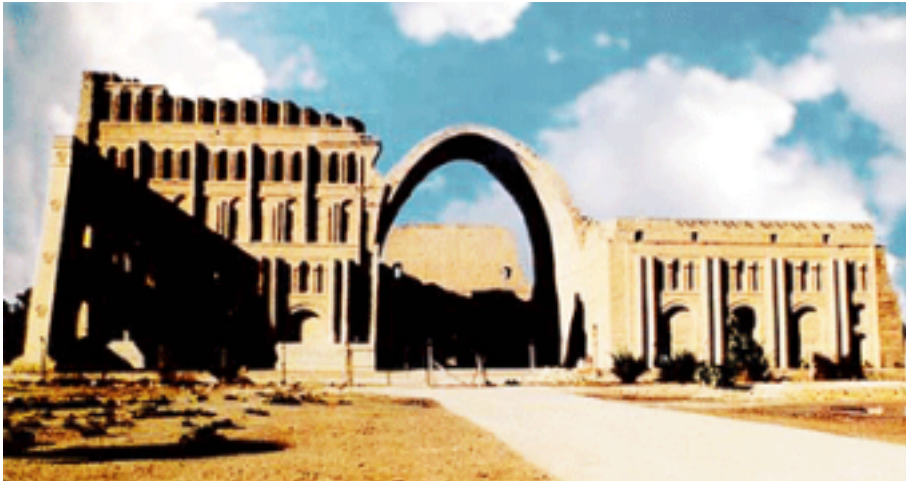
طاق کسری در مدائن

اسقف مذکور مطابق این دستور با شش نفر رفیق خود عازم سفر ترکستان شد. غذای روزانه‌ی این هفت نفر شامل هفت گرده‌ی نان و یک کوزه‌ی آب بود. این هفت نفر نوشتن را به ترک‌ها آموختند و بسیاری از آنان را تعمیر دادند. یک اسقف ارمنی هم به آنان ملحق شد و به ترک‌ها کاشتن گندم و اقسام سبزی‌ها را تعلیم داد. این هفت نفر، هفت سال در ترکستان توقف نموده، بعد به ایران برگشتند. ایلچی امپراتور روم که به ترکستان فرستاده شده بود، با چشمان خود نتیجه‌ی زحمات مبشرین را دیده، تعجب نمود که خدا به وسیله‌ی خدام خود کارهای عجیبی به انجام رسانیده است.