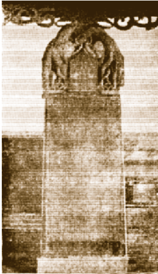
لوح سنگی که انتشار مسیحیت را در چین توسط ایرانیان تصدیق می کند

نمازخانه هم در پایتخت بنا کنند. چینی ها این نمازخانه ها را «معابد ایرانی» می گفته اند. انجیل به ژاپون نیز برده شده و گویند طبیعی ایرانی در قرن هشتم ملکه ی ژاپون را مسیحی نموده است.