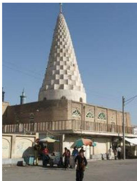
آرامگاه دانیال در شهر شوش در جنوب باختری ایران

کتاب شامل چند اشتباه تاریخی است . وجود واژه های آرامی ، پارسی و یونانی در این کتاب نشان می دهد که این کتاب در دوره های جدید تر نوشته شده است . کتاب دانیال در بخش سوم یا نوشته ها Writings جای داده شده است و نه در بخش دوم یعنی پیامبران Prophets و به این دلیل کتاب دانیال دیرتر از آن نوشته شده که در مجموعه پیامبران جای گیرد . کتاب دانیال در بردارنده برخی رویداد های تاریخی است که مدت ها پس از دانیال رخ داده اند.